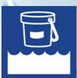
Desinfección & Mantenimiento