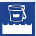
Desinfección & Mantenimiento