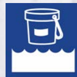
Desinfección & Mantenimiento